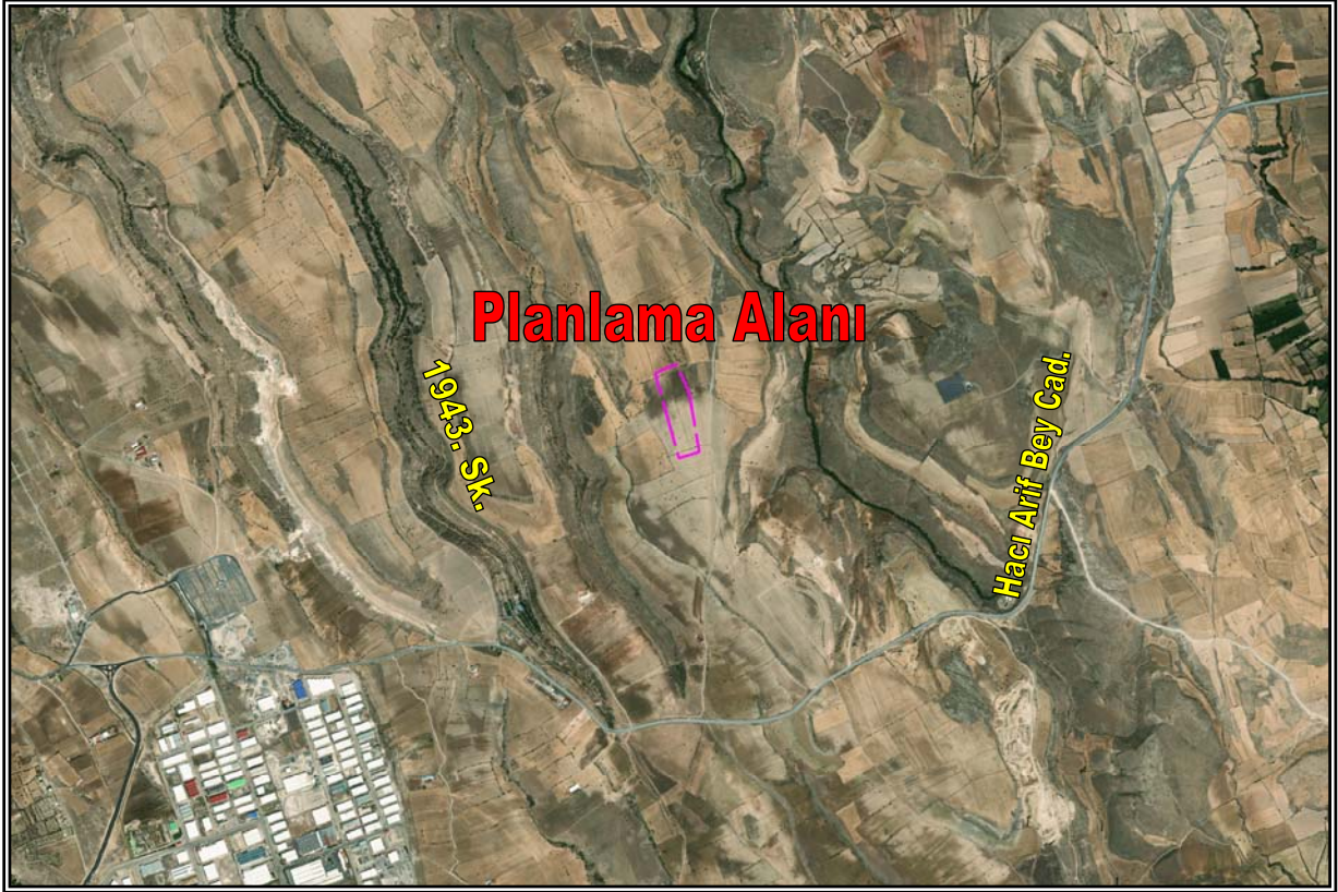
Resim 1: Planlama Alanının Konumu

Planlama alanı düz bir arazi yapısına sahiptir. Bahse konu alan üzerinde herhangi bir yapılaşma görülmemiş olup doğal karakterli boş arazi statüsündedir. Planlama alanının yakın çevresinde ise doğal karakterli boş araziler ve tarım arazileri yer almaktadır.